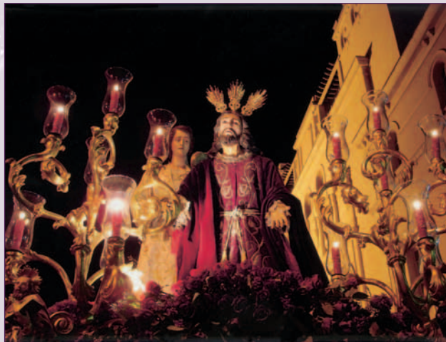
Jesús de la Humildad, S. XVII

♦ Número de Hermanos: 450. Nazarenos: 250.