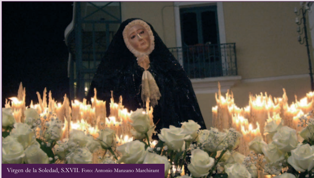
Virgen de la Soledad, S.XVII.

♦ Sede: Ermita de Nuestra Señora de la Soledad