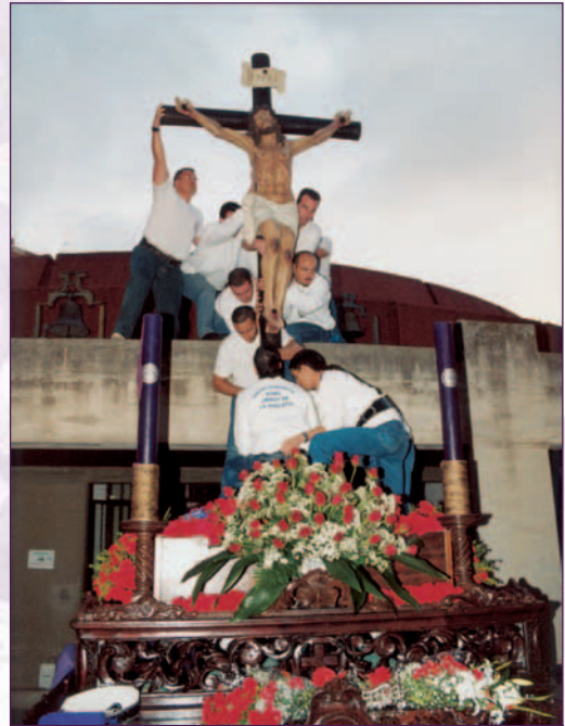
Cristo de la Angustia