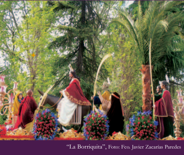
“La Borriquito”, Foto: Fco. Javier Zacarías Paredes