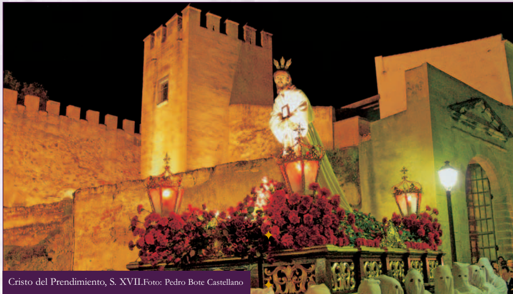
Cristo del Prendimiento, S. XVII.