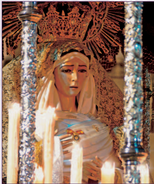
Virgen de la Eperanza.

♦ Bandas de Música: Banda de Cornetas y Tambores de Daimiel (Ciudad Real) y Banda Municipal de Oliva de la Frontera.