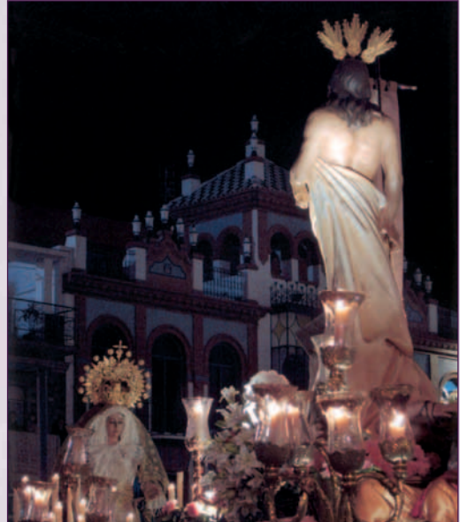
“El Encuentro”.

♦ Comentario. Es una cofradía sencilla enclavada en un histórico marco conventual, donde se enterró la reina Ana de Austria, y que está presidida por la Virgen de las Virtudes y Buen Suceso, antigua Patrona de Badajoz. Las imágenes de la Hermandad protagonizan un alborozado “Encuentro” en San Juan. Es digno de elogio el entusiasmo de la Junta Directiva, su dinamismo y el inestimable apoyo de las religiosas de Santa Ana. La Cofradía tiene su propia Banda de Cornetas y Tambores, que este año estrena sus uniformes. El paso de la Virgen está llevado y guiado por mujeres.