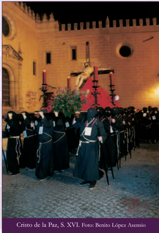
Cristo de la Paz, S. XVI.

Plaza de Santiago Arolo, calle Porvenir, General Mola, Juan Pablo Fórner, Alfonso XIII, Avda. Ricardo Carapeto, Puente del Revellín, Parque de la Legión, Plaza 18 de Diciembre, calle Eugenio Hermoso, Bravo Murillo, Arias Montano, Plaza de la Soledad, calle Francisco Pizarro, Vicente Barrantes, Plaza de España (Carrera Oficial), calle San Blas, Plaza de Cervantes, calle Trinidad, Plaza 18 de Diciembre, Parque de la Legión, Puente de San Roque, Avda. Ricardo Carapeto, calle General Mola, Porvenir, Plaza de Santiago Arolo y a su templo.